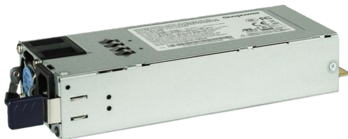
Таблица 2. Источники питания коммутатора N5000

Коммутатор агрегации N5000 поддерживает установку двух резервируемых источников питания с возможностью горячей замены.