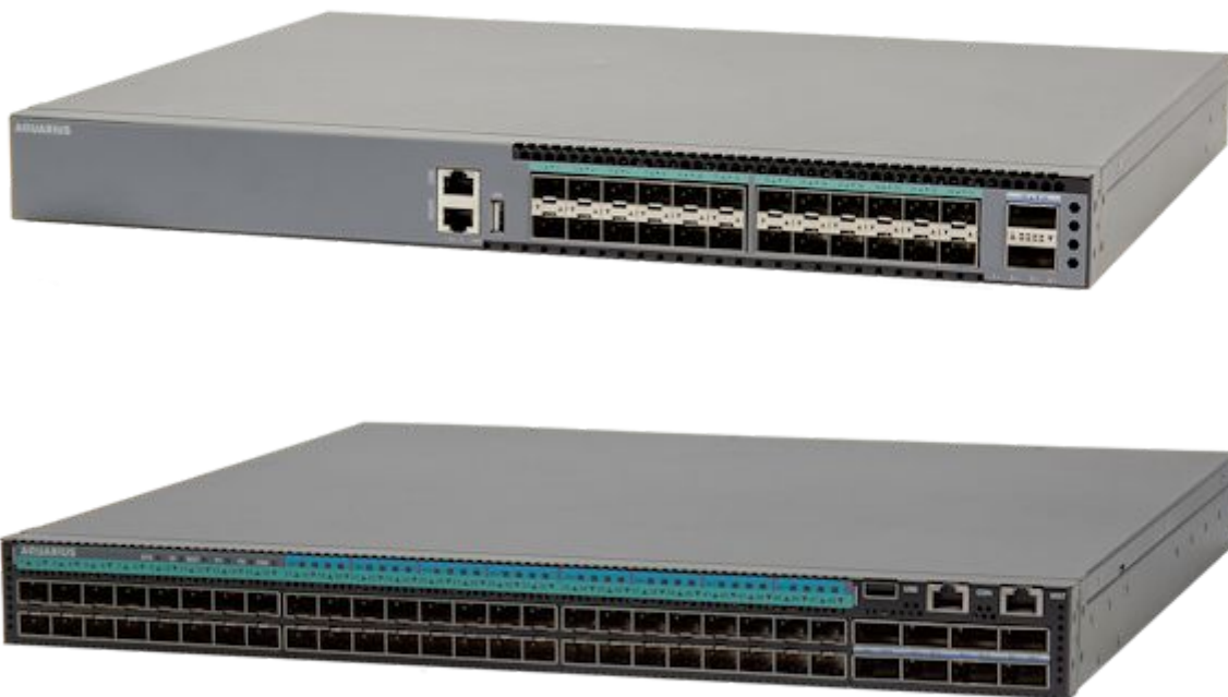
Таблица 1. Доступная конфигурация и основные характеристики N5000