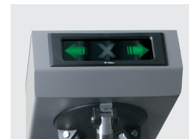
Табло индикации с пиктограммами