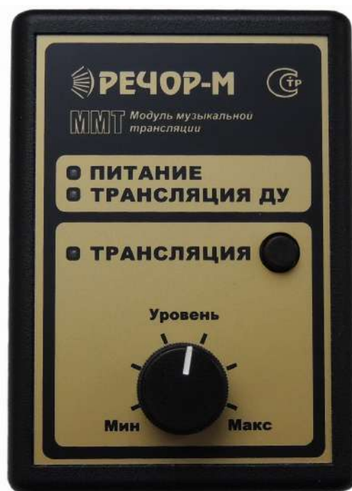
Рис. 1 Общий вид модуля ММТ

Для установки номинального уровня симметричного сигнала на выходе модуля может быть использован встроенный регулятор УРОВЕНЬ.