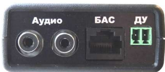
Рис. 2 Вид коммутационной панели модуля ММТ

На коммутационной панели модуля (см. Рис. 2) размещены следующие разъемы: